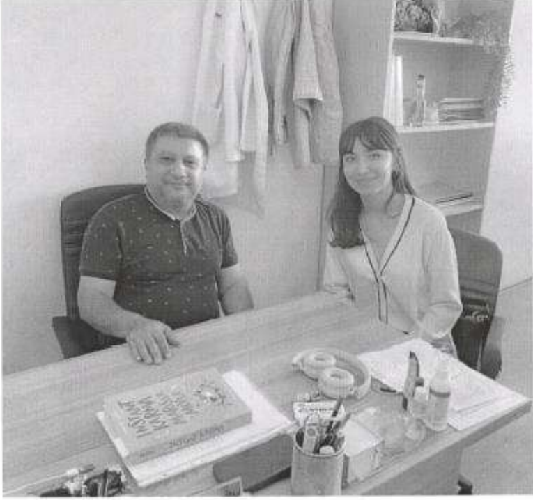
Ek-2 Toplantı Görsele