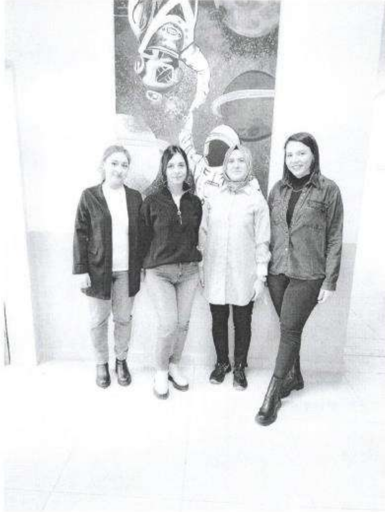
Ek 2. Toplantı Fotoğrafi